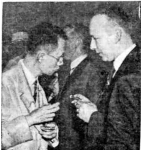
En la Conferencia de Universidades los delegados de China y Nueva Zelanda estudian los problemas de sus países respectivos.

[Para más informaciones sobre la Conferencia de Utrecht véase "El Correo" de la Unesco, vol I No 7 (pp 1 y 2), No 5 (p. 8), No 3 (p. 8).]