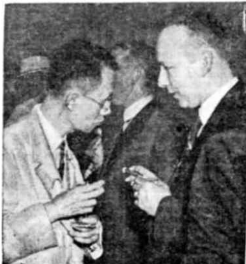
En la Conferencia de Universidades los delegados de China y Nueva Zelanda estudian los problemas de sus países respectivos.

Por otra parte el Occidente debe enseñar al Oriente la dignidad de la persona y otros conceptos democráticos, y si el Occidente pierde la confianza en su propia doctrina de una sociedad individualista (como decía el Dr. Benes: "la teoría de la sociedad liberal ha sido práctica y teóricamente rebasada"), el Oriente, desde su propia perspectiva, puede decirle: "Qué necios sois!, estais desechando la mejor cosa. Podeis desear prácticamente algunas de sus formas y modificarlas. Pero si desechais teóricamente la concepción básica según la cual el Estado existe para el individuo y no el individuo para el Estado, entonces estaréis perdidos".