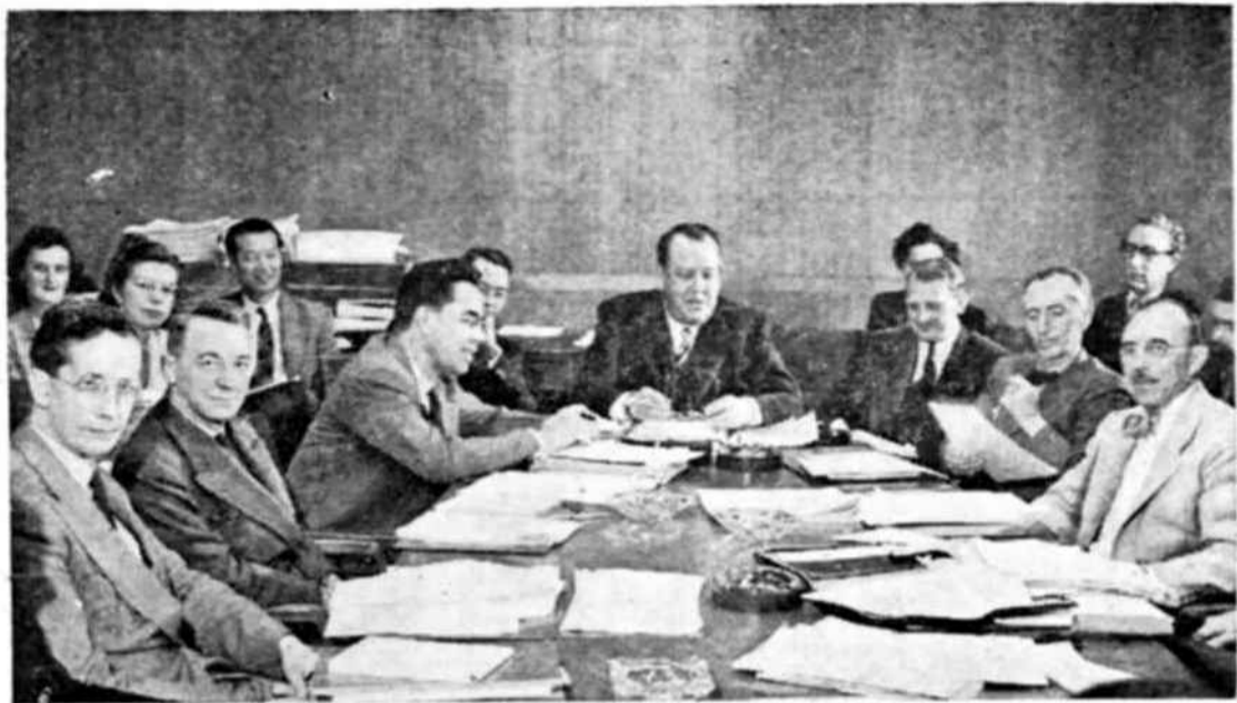
Trygve Lie, Secretario General de la O.N.U. (centro), conferencia con los representantes de las Instituciones especializadas. Foto tomada en el curso de una reunión celebrada en Ginebra últimamente.