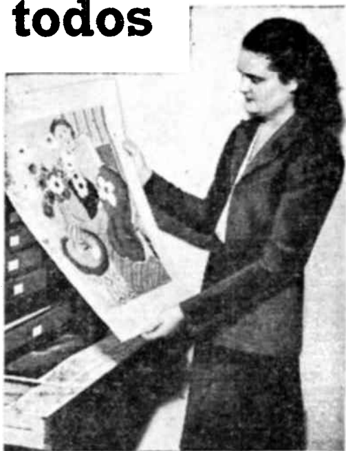
Examinando una de las muestras de reproducción en colores, en los archivos de la Unesco.

ducción y en definitiva al abaratamiento de las obras que se destinen al público, sin pérdida de la calidad y sobre todo de la "fidelidad" que se debe al original, en este género de empresas.