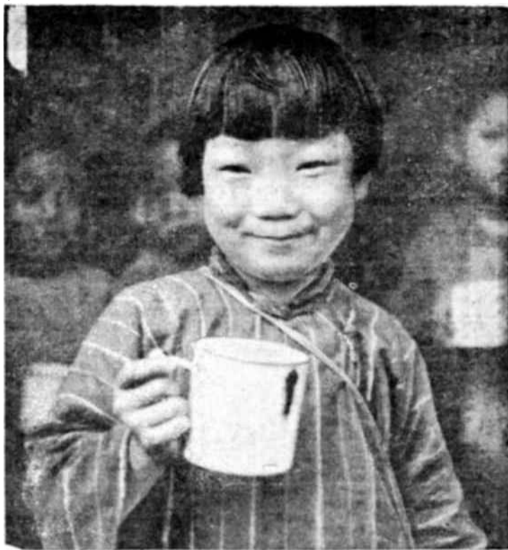
Una niña china reconfortada por los cuidados de una de las asociaciones de Ayuda a China. Pero millones y millones precisan idéntico socorro.

Puede resumirse como sigue el informe redactado por la Comisión Preparatoria Internacional, aprobado por el Congreso. Quizá la contribución más im-