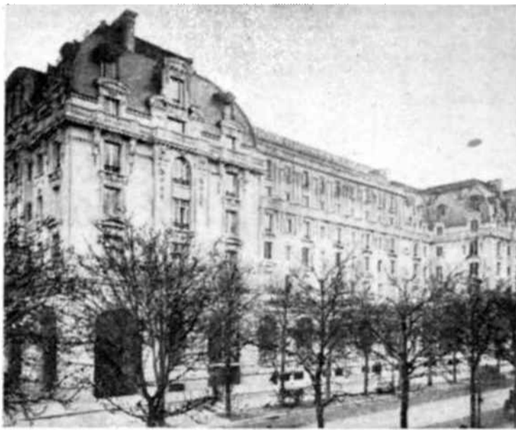
La Casa de la Unesco en París, donde tendrá lugar la reunión extraordinaria de la Conferencia General, el 15 de Septiembre.

Esta reunión extraordinaria ha sido necesaria dada la situación anormal en el Oriente Medio, que pudiera obligar a un aplazamiento de la Tercera Reunión e incluso a la designación de otro lugar, como sede de la misma.