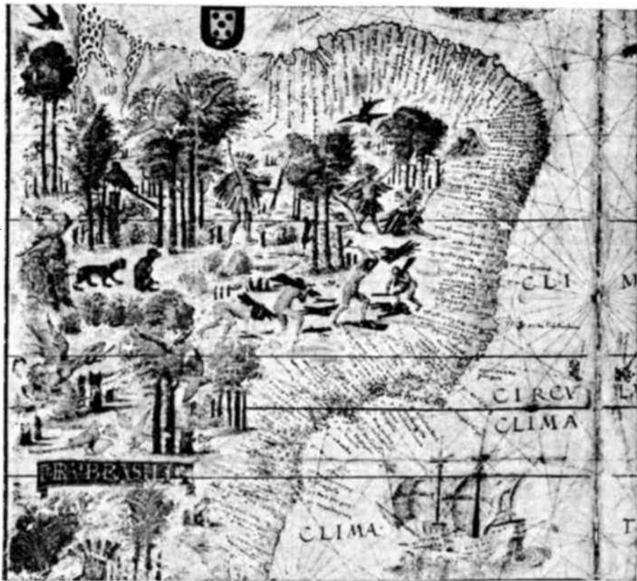
El Brasil visto por un cartógrafo portugués, en el año 1500, a los 19 de su descubrimiento.

En todo caso, aunque las tribus indias de la cuenca amazónica fueran primitivamente de tipo matriarcal, no debemos buscar allí el origen del mito de las Ikamiabas. Es más probable que la leyenda de las amazonas haya sido traída a los indios por las gentes que venían de "El mejor de los Mundos", sedientos de riquezas y de aventuras.