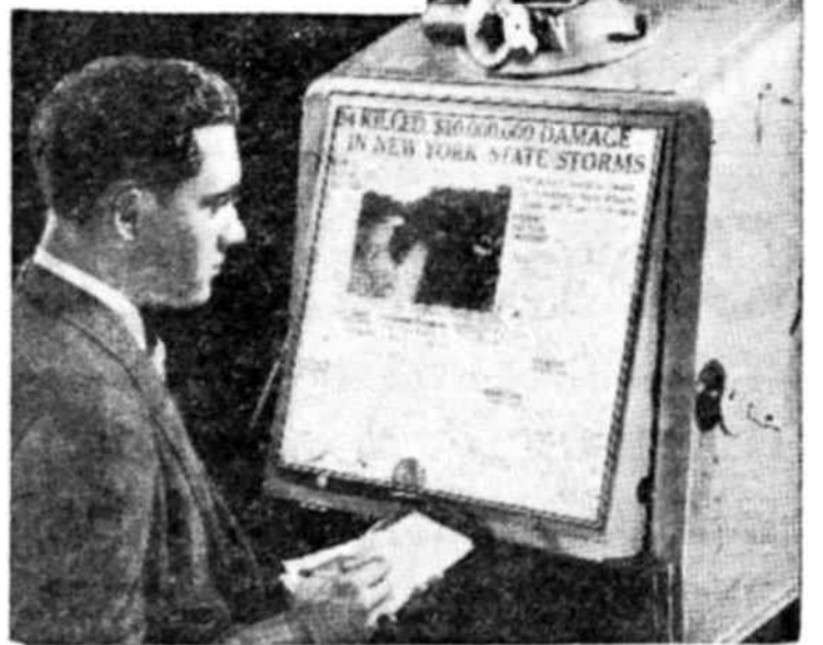
Un aparato de lectura de microfilms.

La Unesco anunció el 19 de agosto que diez y seis aparatos para lectura de microfilms habían sido depositados en las respectivas Embajadas en París de siete países devastados por la guerra.