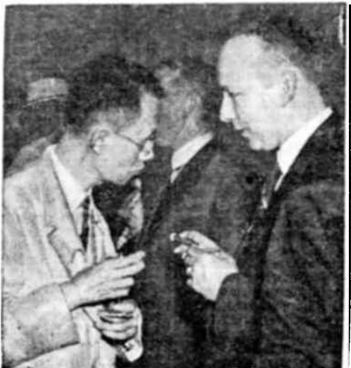
En la Conferencia de Universidades los delegados de China y Nueva Zelanda estudian los problemas de sus países respectivos.

Por otra parte el Occidente debe enseñar al Oriente la dignidad de la persona y otros conceptos democráticos, y si el Occidente pierde la confianza en su propia doctrina de una sociedad individualista (como decía el Dr. Benes: "la teoría de la sociedad liberal ha sido práctica y teóricamente rebasada"), el Oriente, desde su propia perspectiva, puede decirle: "Qué necios sois!, estais desechando la mejor cosa. Podeis desear prácticamente algunas de sus formas y modificarlas. Pero si desechais teóricamente la concepción básica según la cual el Estado existe para el individuo y no el individuo para el Estado, entonces estaréis perdidos".