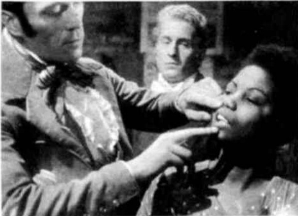
El espectáculo inicuo de las subastas de negros, donde éstos eran examinados y vendidos igual que si se tratase de ganado, así como el mal tratamiento que les infligían los colonos en sus plantaciones, determinaron la cruzada anti-esclavista de Schœlcher.