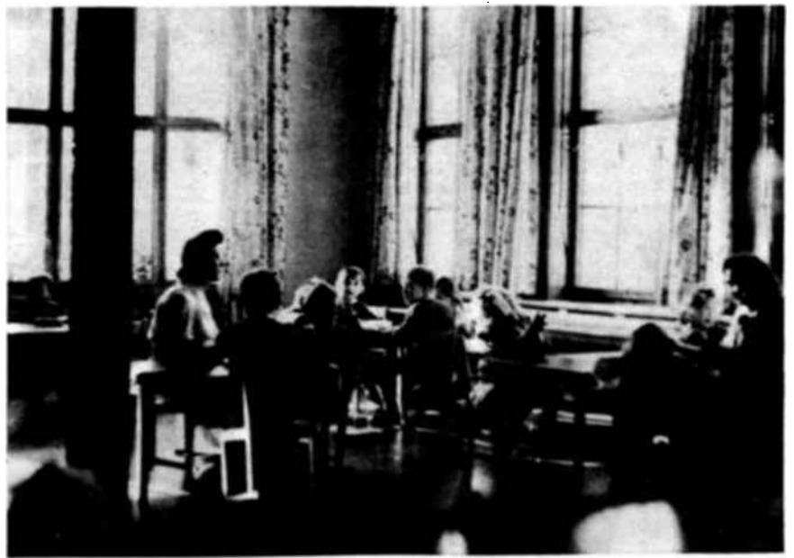
En el período de formación que comprende hasta los siete años de edad, la conciencia social del niño va desarrollándose lentamente. Es, en realidad, el primer esfuerzo de la personalidad por adaptarse al medio ambiente, reconociendo los derechos ajenos. Encauzado con habilidad, ese esfuerzo puede convertirse en un espíritu de tolerancia y comprensión, virtudes de las que el mundo anda cada día más necesitado. A ese objeto, muchas organizaciones no gubernamentales vienen trabajando en la actualidad con la Unesco, mejorando y extendiendo las aplicaciones de la educación pre-escolar.

La Asociación Internacional de Catedráticos y Ayudantes de Cátedra se ha puesto en relación con la UNESCO a fin de estudiar los diversos