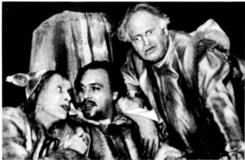
Uno de los fines que persigue la Unesco en Alemania es el estimular a los organismos que se interesan en la cultura popular, tales como la Federación Sindical de la Alemania Occidental, bajo el patrocinio de la cual se ha desarrollado, este verano, el Festival Teatral del Ruhr. Vemos, aquí, una escena del Rey Lear interpretada por actores alemanes. Esos actores, como todos los que han prestado su concurso al Festival, se han propuesto el facilitar a la clase obrera alemana la más amplia comprensión de la cultura europea.

No cabe duda que la creación de esa Comisión habrá de traducirse en una participación más activa de Alemania en la obra de la UNESCO y permitirá a ese país el desempeñar un papel cada vez más importante en el desarrollo de la cooperación cultural internacional.