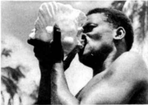
Al confirmarse en la Martinica la liberación de los esclavos, nació de sus labios « La Montaña es Verde », como oración de gracias a Victor Schœlcher, su emancipador.