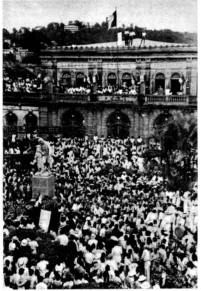
El pueblo de las Antillas Francesas honra la memoria de Schœlcher con grandes manifestaciones de alegría, entonando « La Montaña es Verde ».