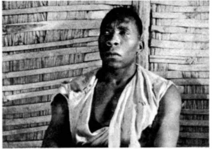
Cuando en 1829 Victor Schœlcher visitó las Antillas francesas, quedó impresionado por las terribles condiciones en que se desarrollaba la existencia de los esclavos. Veinte años más tarde, la esclavitud quedaba finalmente abolida en todas las colonias francesas, y ello gracias, en gran parte, a la campaña efectuada por Schœlcher. En la película « La Montaña es Verde » el papel de éste es interpretado por Michel Vitold (arriba, izquierda). Una agrupación folklórica martiniquesa representa a los esclavos que fueron emancipados.