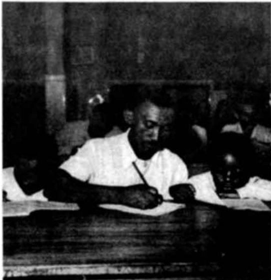
« Una nueva vida está surgiendo para los habitantes de Cachoeiro. » Para los mayores el hecho es aún más sorprendente que para sus niños. Unos y otros se asoman con esperanza al mundo de la instrucción.