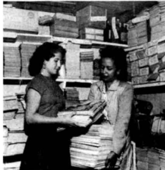
Aquellos que aprendan a leer y escribir en las clases de Cachoeiro tendrán su premio. A los hombres se les entregan revistas y a las mujeres se les ofrecen clases de corte y confección. Claro está que la verdadera recompensa consiste en verse liberados del vergonzoso analfabetismo.