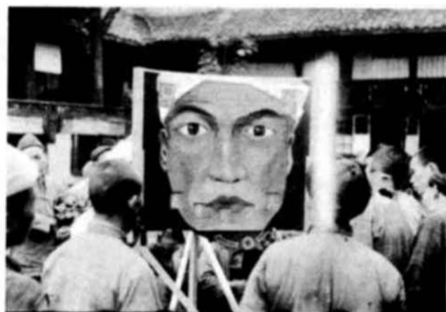
ofrecerse a los atacados de tracoma: la ceguera final o el mejoramiento progresivo hasta la curación absoluta.