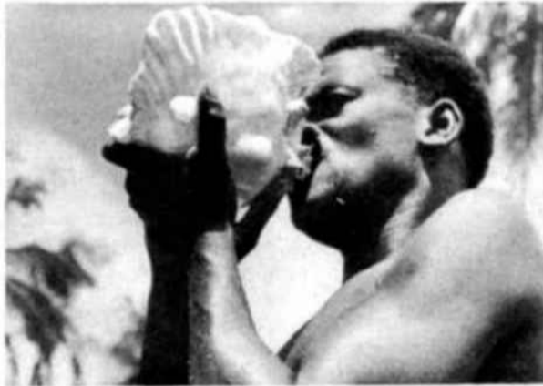
Al confirmarse en la Martinica la liberación de los esclavos, nació de sus labios « La Montaña es Verde », como oración de gracias a Victor Schœlcher, su emancipador.