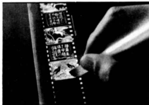
china sobre una película blanca. Otro método empleado (arriba, a la derecha) fué el dibujar directamente sobre películas expuestas a la luz, y por lo tanto ya impresionadas, con una aguja que hacía las veces de buril, logrando un dibujo de blanco sobre negro.

procedimiento del grabado. Para ello utilizó películas emulsionadas y ya expuesta a la luz, es decir, películas negras (impresionadas), e hizo ejecutar directamente sobre esas películas dibujos hechos con una aguja. La aguja hacía las veces de buril y levantaba la emulsión, logrando un dibujo de blanco sobre negro.