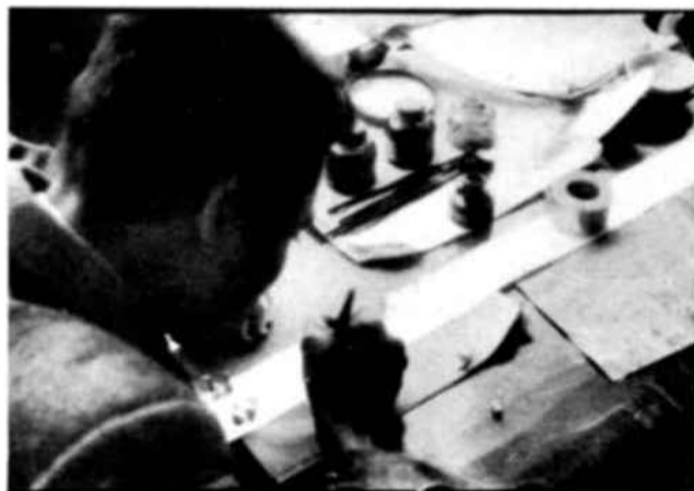
En vez de emplear el procedimiento corriente de dibujar por separado las figuras y luego fotografiarlas, los artistas chinos que colaboraron con la Unesco en el ensayo de Pehpei, las grababan directamente sobre una película de 35 mm. El artista que aquí vemos está dibujando con tinta