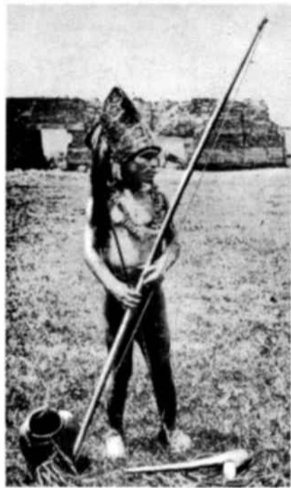
Una de las pocas fotografías que han podido obtenerse de la tribu Guayaki, que habita en las selvas del Paraná (Paraguay Oriental). Testimonio de una de las modalidades de cultura más primitivas del Hemisferio Occidental, los guayaki viven casi aislados del resto de las tribus guaraníes pobladoras de la región. Aun hoy en día constituyen «una curiosidad etnológica».

hueso, algunos collares y cuerdas. Se refugian en cabañas de ramaje que levantan en escasos minutos. Esos indios viven aislados en sus selvas. Por su género de vida, apenas si difieren de los primeros grupos humanos que hace algunos milenios tomaron posesión de