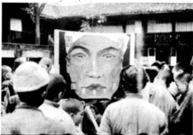
Anuncios de dos caras fueron utilizados por el equipo de la Unesco para mostrar las dos alternativas que pueden

Uno de los instrumentos más útiles entre los aplicados por la misión de la Unesco en China, a fin de enseñar a los nativos algunos principios elementales de higiene, fué este del anuncio cambiante. La presente fotografía, sacada cerca de Pehpei, muestra a uno de los « propagandistas de la profilaxis » mostrando, a través de ocho estadios diferentes, como los ojos atacados por el tracoma pueden recobrar su claridad y brillo normales gracias a un tratamiento regular. Tras de una breve conferencia sobre las causas y los efectos del tracoma, el colaborador de la Unesco examinaba al público reunido en su torno, recomendando a los enfermos de la vista la mejor terapéutica para su dolencia.