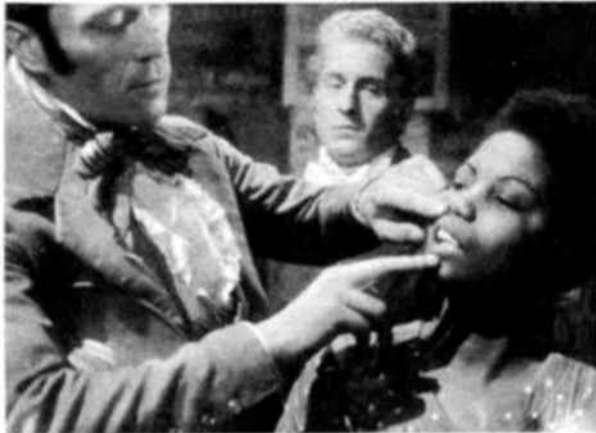
El espectáculo inicuo de las subastas de negros, donde éstos eran examinados y vendidos igual que si se tratase de ganado, así como el mal tratamiento que les infligían los colonos en sus plantaciones, determinaron la cruzada anti-esclavista de Schœlcher.