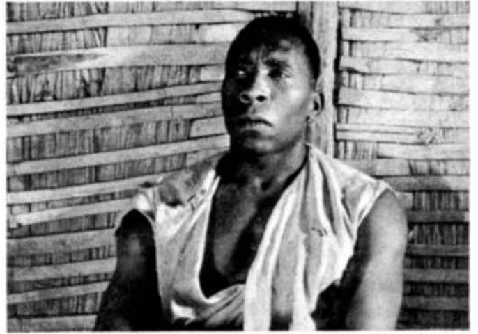
Cuando en 1829 Victor Schœlcher visitó las Antillas francesas, quedó impresionado por las terribles condiciones en que se desarrollaba la existencia de los esclavos. Veinte años más tarde, la esclavitud quedaba finalmente abolida en todas las colonias francesas, y ello gracias, en gran parte, a la campaña efectuada por Schœlcher. En la película « La Montaña es Verde » el papel de éste es interpretado por Michel Vitold (arriba, izquierda). Una agrupación folklórica martiniquesa representa a los esclavos que fueron emancipados.