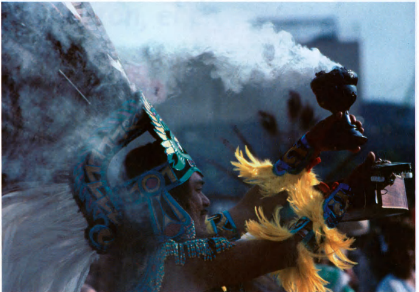
Fiesta en honor de la Virgen de Guadalupe, en México.

ritmos naturales a los gestos sagrados, se crea una tensión entre dos polos: el de una existencia biológica aun no simbolizada y el de una vida considerada espiritual porque da sentido al conjunto de la cultura. El hombre convierte la aparente contingencia de los ciclos que son naturalmente suyos en un orden intencional: regula su respiración u observa los latidos de su corazón de modo tal que expresen lo mejor posible “la huella divina de la armonía”. 5 De profana e insignificante, la vida biológica pasa a ser soporte de lo sagrado. La mayoría de los ritos de iniciación que se proponen conferir al neófito un “segundo nacimiento” se basan precisamente en este tipo de concepción.