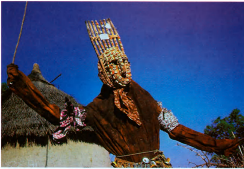
Máscara bambara de un espíritu terrorífico (Mali).

zarlo". Tras establecer la comunicación, puede comenzar a trabajar.