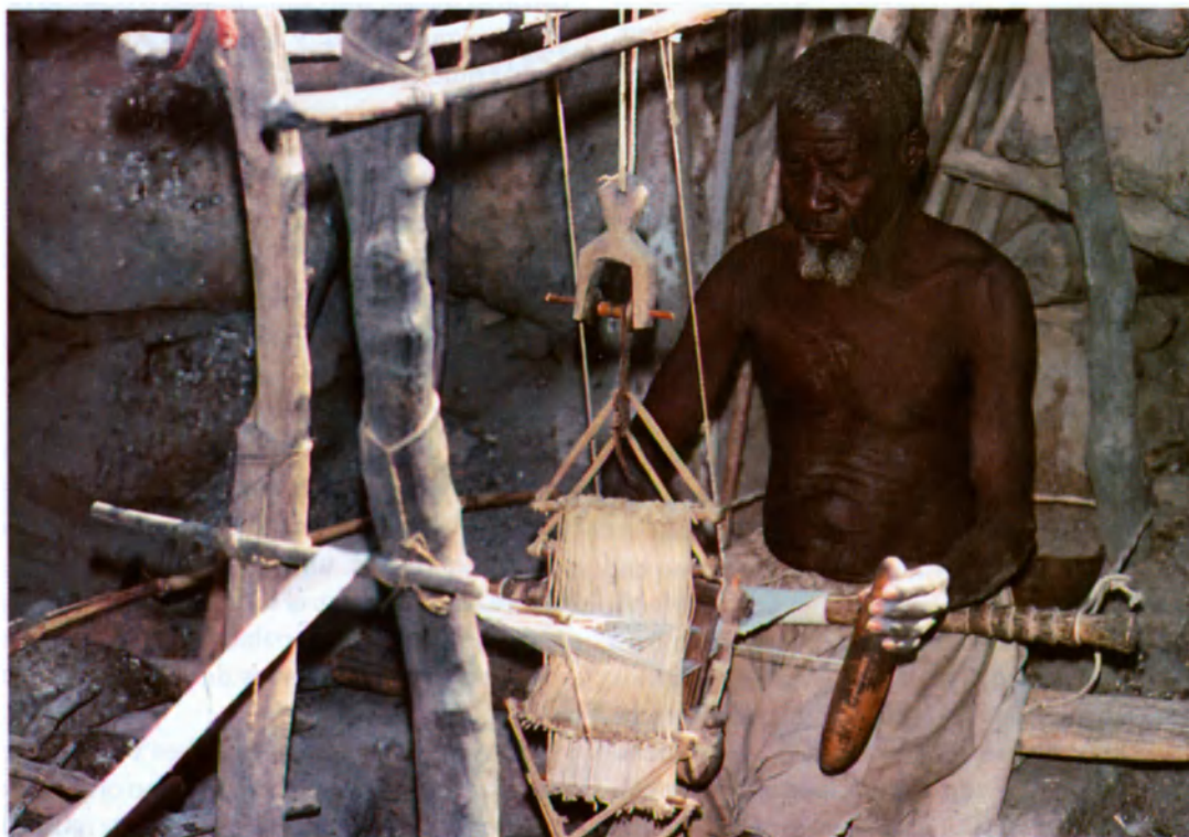
Tejedor dogon en Malí.

Toma su maza, que simboliza el falo, y con ella da unos golpes sobre el yunque para “sensibili-