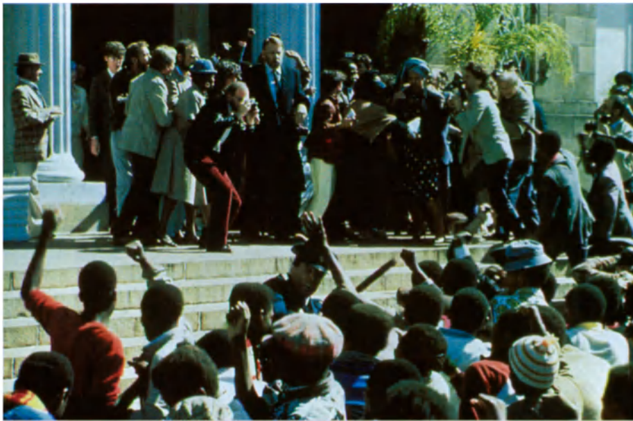
Junto a estas líneas y a la derecha, dos escenas de Una estación blanca y seca (1989), película de Euzhan Palcy, basada en la novela de André Brink.

llevando una vida sumamente agradable, era demasiado fácil. Tenía que comprometerme, entablar el diálogo con la sociedad a la que pertenecía, intentar lo que los estudiantes de París trataban de hacer en su medio: transformar la sociedad.