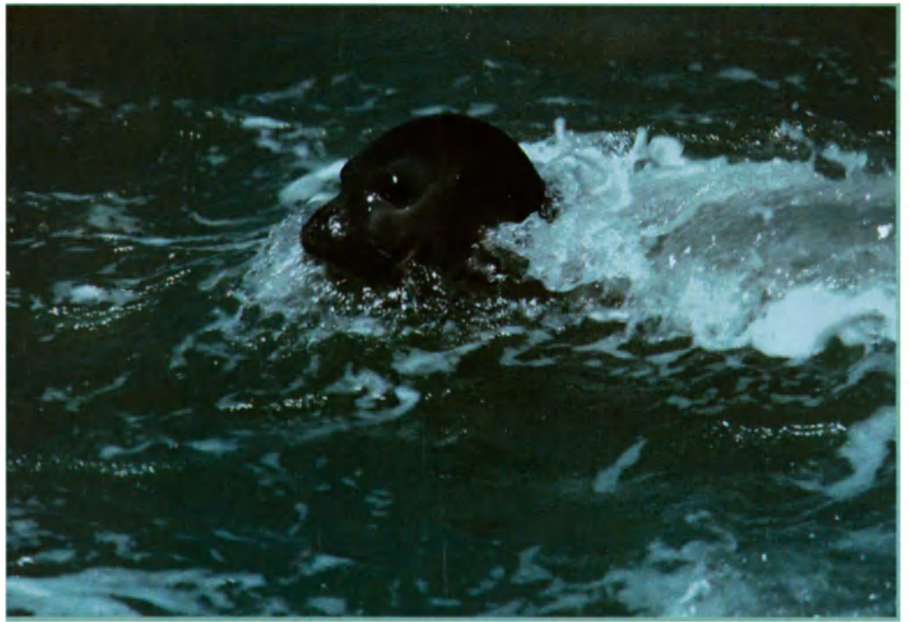
Foca fraile del Mediterráneo.

Pero la riqueza histórica, la hospitalidad y la permanente belleza del Mediterráneo acarrearán también inconvenientes. Las ciudades costeras han llegado a tener dimensiones muy considerables, sobre todo en el sur, donde el crecimiento demográfico sigue un ritmo galopante. El Cairo tiene más de doce millones de habitantes; Alejandría, cinco millones; Argel, un millón y medio; Trípoli, un millón doscientos mil habitantes. Cien millones de personas viven actualmente en las costas del Mediterráneo, cifra que, según previsiones, se duplicará de aquí al año 2025. Para esa misma fecha los turistas, tanto nacionales como internacionales, pasarán de cien millones anuales a trescientos millones. Esta auténtica marea humana genera un incremento constante de desechos que los Estados no tienen medios para tratar. Los transportes que los turistas emplean son también una fuente de contaminación. Y como acuden sobre todo en verano, o sea