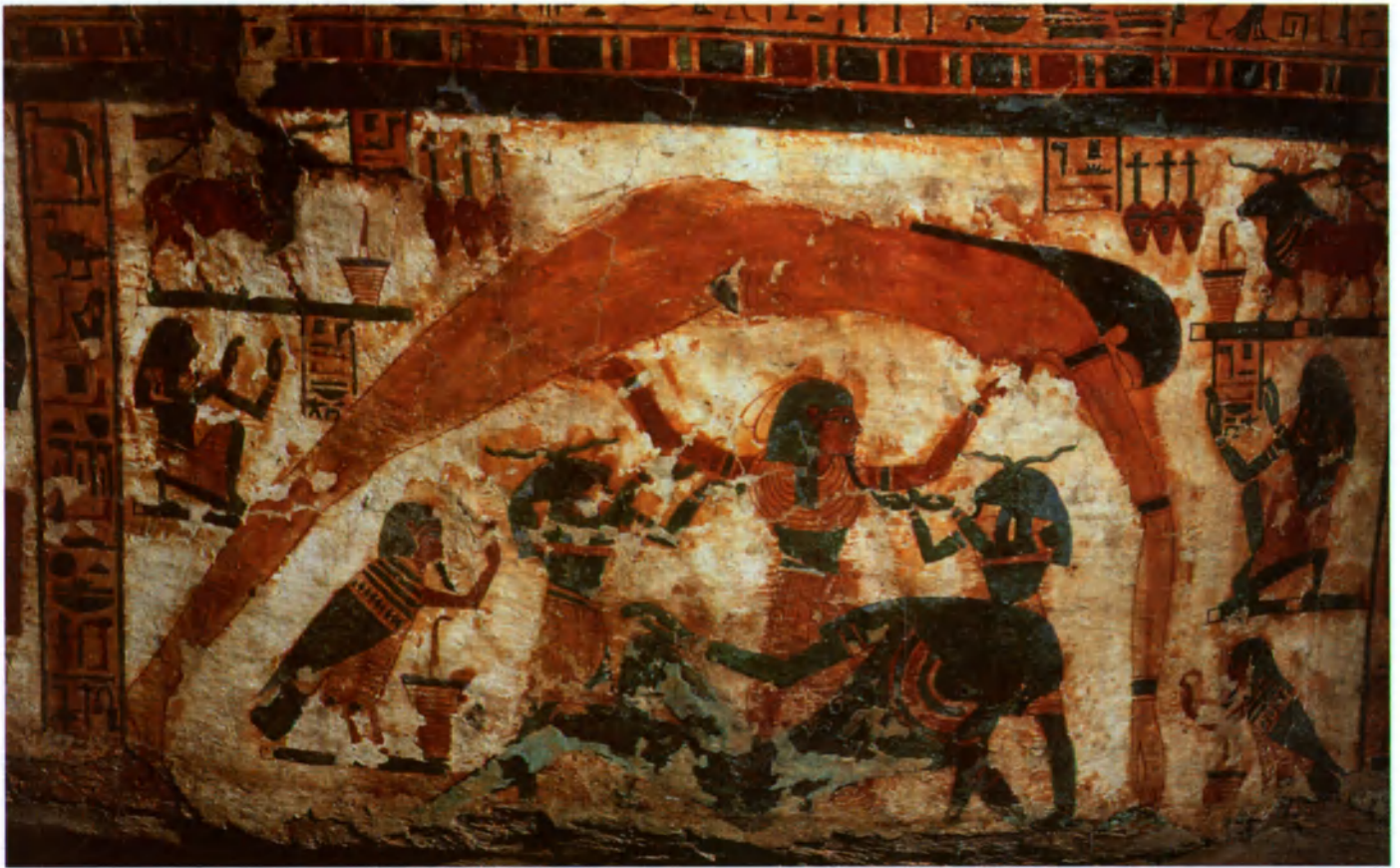
El dios egipcio del Aire, Shu, sostiene a Nut, diosa del Cielo, cuyo cuerpo forma un arco por encima de la Tierra. Pintura cosmogónica de un sarcófago del antiguo Egipto.