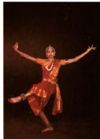
Nuestra portada: La bailarina india Shantala Shivalingappa.

9 Editorial de Bahgat Elnadi y Adel Rifaat