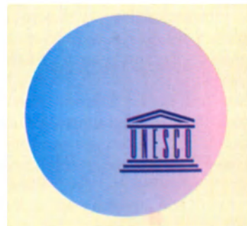
Textos seleccionados y presentados por Edgardo Canton

Y si la preocupación por los aspectos intelectuales de más alto nivel no domina y orienta la actividad de la cooperación intelectual, ésta nunca será comprendida por aquéllos a quienes se destina y no tendrá la menor influencia en la enseñanza, en la producción, en la opinión general y, por ende, en el papel de las ideas del hombre moderno, elemento deseable e indispensable de la Sociedad de Naciones. ■