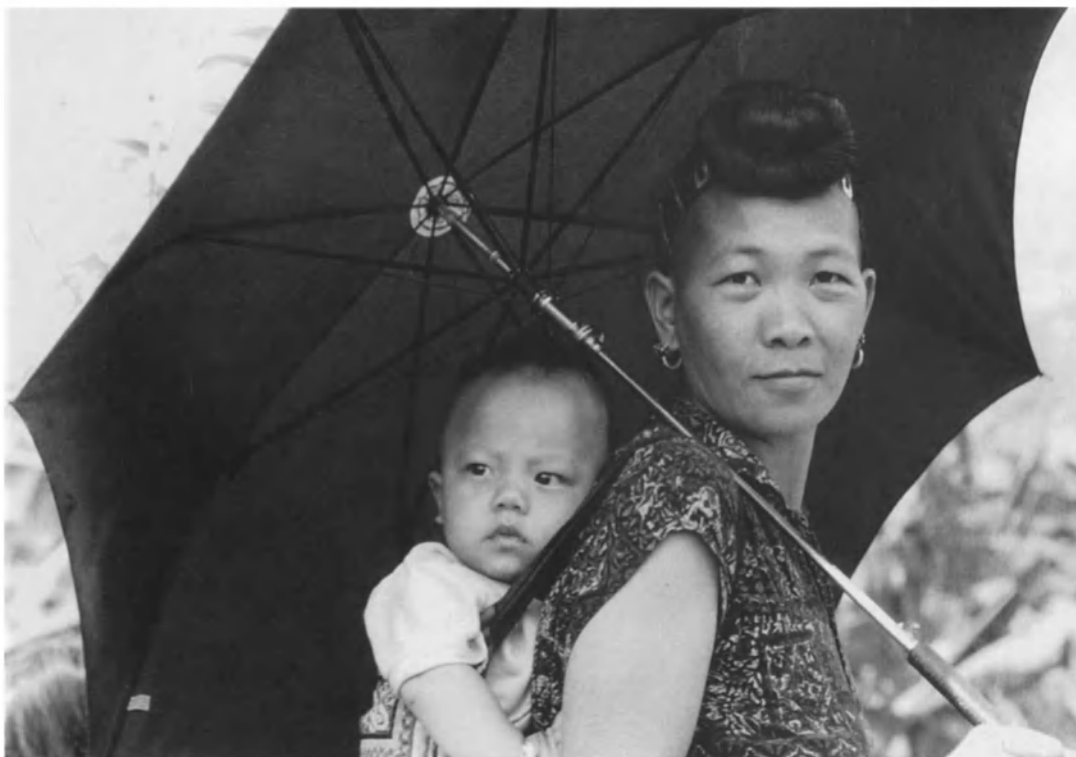
El contacto con el cuerpo materno: una madre mon con su bebé a la espalda (Tailandia).

También los psicoanalistas, ya se trate de Wilfred Bion, Donald Winnicott, Marion Milner o Françoise Dolto, por haber estudiado el origen de la formación de la psique, están familiarizados con los estados místicos. También ellos aluden a esas esferas oceánicas en que se encuentra el bebé, a la permeabilidad del pensamiento y la comprensión del estado de ánimo del recién nacido. Este