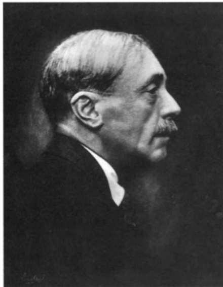
El escritor francés Paul Valéry en 1937.

Lo que caracteriza a la Sociedad de Naciones es que responde a una urgencia. Nuestra urgencia es la vida del espíritu. No nos neguemos a reconocer que está amenazada, directamente por la inquietud del mañana y por la inestabilidad de la vida política, indirectamente por el régimen industrial y por la crisis que atraviesa. Tal vez sea posible vislumbrar para el futuro de la inteligencia ámbitos selectos y cerrados, retiros privilegiados, aislamientos que serán en cierto modo garantía de su libertad. Pero el espíritu sólo se expresa plenamente si no se mantiene al margen, si se mezcla con el mundo e incluso con sus peligros, y apunta hacia una hegemonía, no sorda y discutida, sino brillante y reconocida.