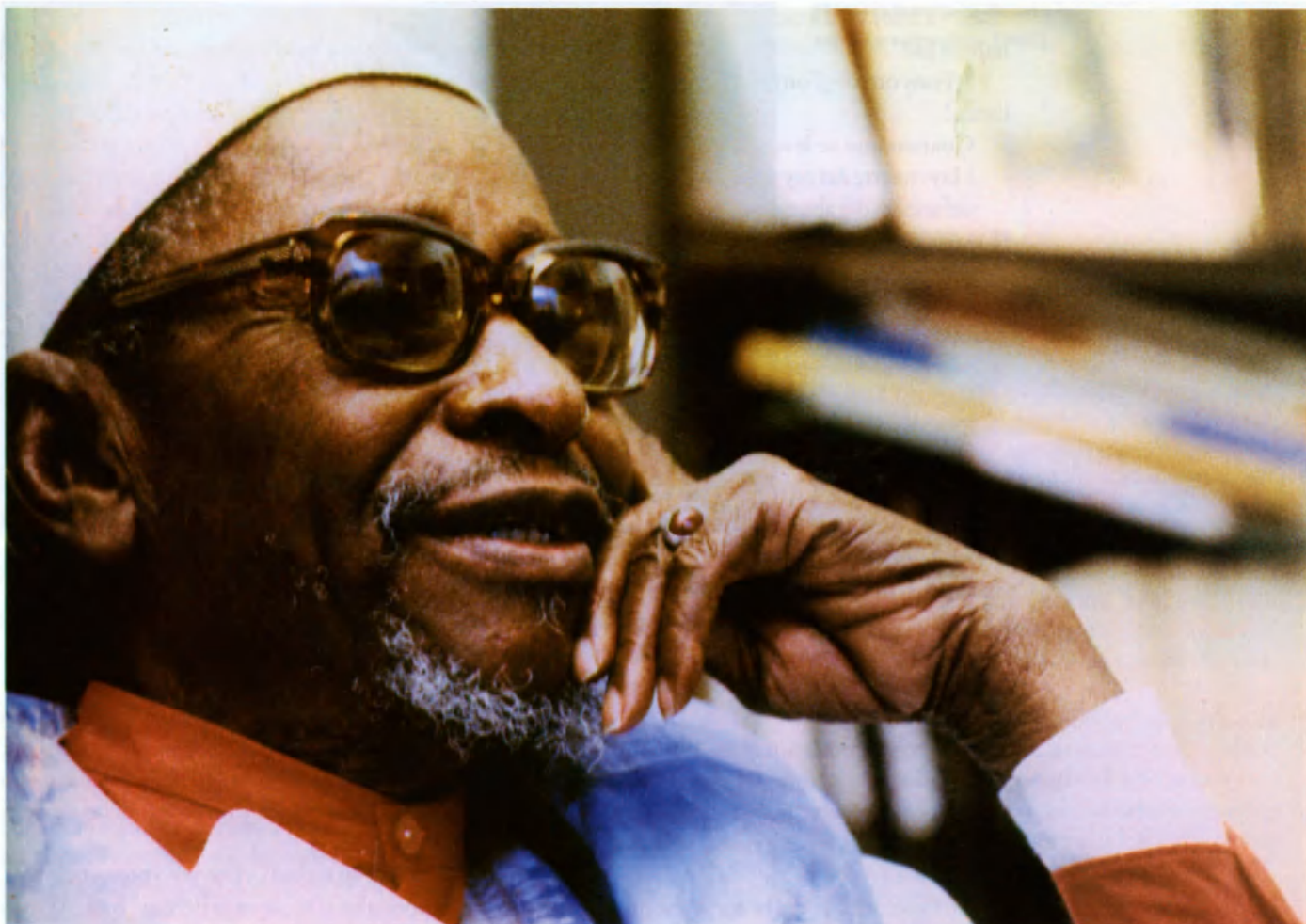
Amadou Hampâté Bâ en París en 1981.

números. Es necesario que la palabra reproduzca el vaivén que constituye la esencia del ritmo.