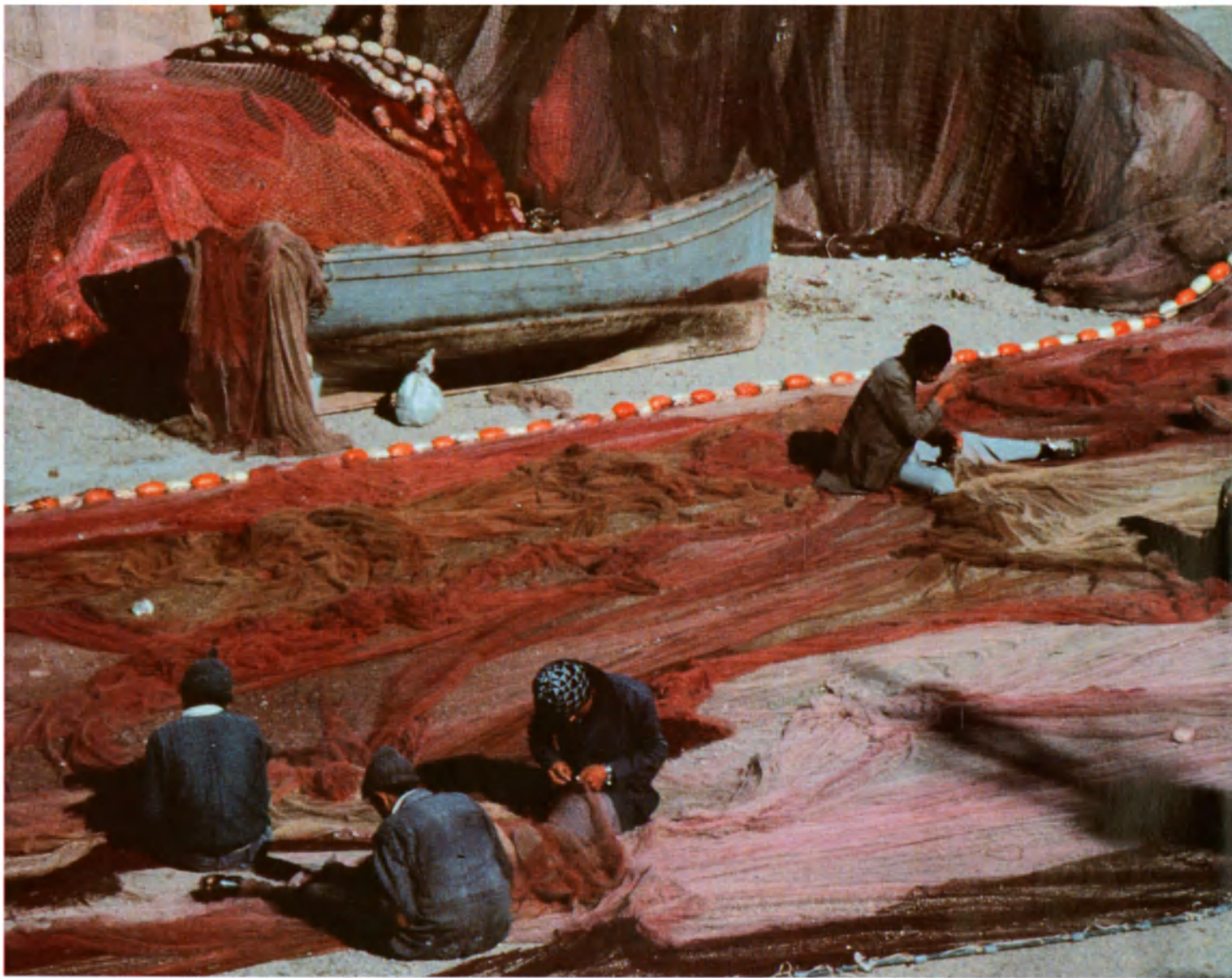
Reparando las redes en Essaouira (antiguo Mogador), puerto de la costa atlántica de Marruecos.