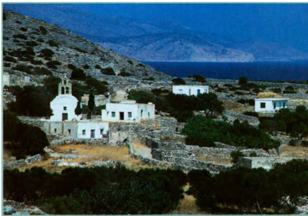
Paisaje del archipiélago de las Cícladas, en el mar Egeo, Grecia.

fectamente limpia. El petróleo derramado se dispersa muy deprisa. Es cierto que la atmósfera aporta metales pesados, que de algunos fondos brota mercurio natural y que convendría estudiar la contaminación de los sedimentos. Pero la toxicidad del pescado está por demostrar, aunque se haya recomendado a los pescadores que no lo consuman en todas las comidas."