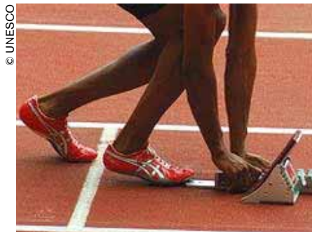
Atleta preparándose para una competición de velocidad.

República Federal Alemana (RFA) lograban mejores resultados que sus colegas de la RDA. A partir de ese año se produjo un cambio espectacular. El régimen comunista de Alemania Oriental se preparó con varios años de antelación para arrebatarle a Alemania Occidental la supremacía en los Juegos Olímpicos de Múnich de 1972, donde ésta esperaba desempeñar un papel de primerísimo plano.