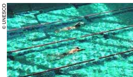
Competición de natación donde “reinaron” los nadadores de Alemania Oriental durante décadas.

Con 40 medallas de oro, la RDA obtuvo el segundo puesto en el medallero de los Juegos Olímpicos de Montreal en 1976 y sólo fue superada en esa ocasión por la Unión Soviética. Once de esas medallas fueron conquistadas en disciplinas de atletismo y otras 11 más en natación. Salvo en dos casos, todos los gana-