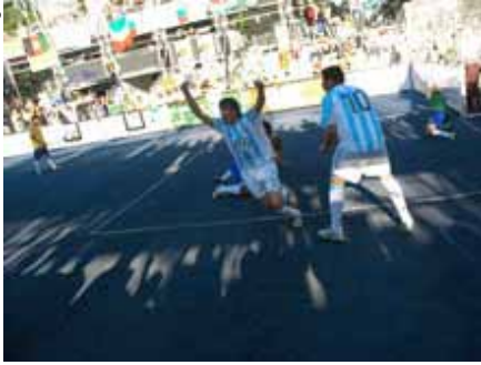
Un partido de fútbol callejero entre Argentina y Brasil.

alquiler precio puede conducir también al dopaje. Taylor Houton empleó esteroides anabólicos porque vio que sus compañeros de la escuela secundaria lo hacían para mejorar su rendimiento y creyó que