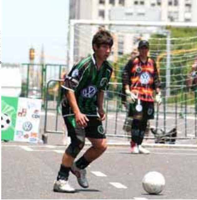
La final del sudamericano de fútbol callejero se disputó en la principal avenida de Buenos Aires.