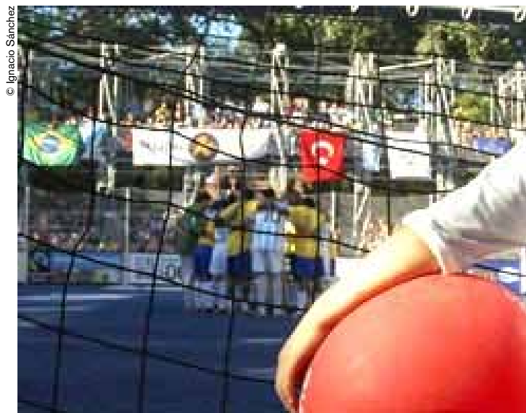
Torneo sudamericano de fútbol callejero en Buenos Aires.

Defensores representó a Argentina en el primer Mundial de fútbol callejero que acaba de disputarse en Alemania al margen de la Copa del Mundo de la FIFA, con las reglas características del fútbol callejero: además de jugar al aire libre, en terrenos baldíos o canchas a cielo abierto, los encuentros se disputan sin árbitros, algo que sería el sueño de muchas selecciones nacionales,