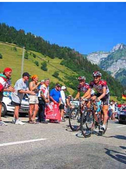
Jan Ullrich e Ivan Basso en el Tour de Francia 2004. Ullrich y Basso fueron dos de los 58 corredores presuntamente implicados en una red de dopaje sanguíneo en vísperas del Tour 2006.

Se creyó que el Tour de Francia del año 2006 iba a partir sobre nuevas bases. Sin embargo, pocas semanas antes de que comenzase la ronda, una investigación de gran envergadura emprendida en España con el nombre de “Operación Puerto” demostró la implicación de 58 ciclistas profesionales en una red de dopaje sanguíneo. Entre ellos figuraban tres ciclistas de renombre: Jan Ullrich, Ivan Basso y Francisco Mancebo.