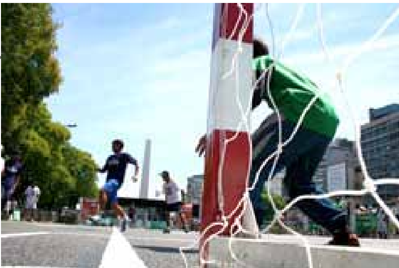
Partido de fútbol callejero en la avenida porteña 9 de Julio.