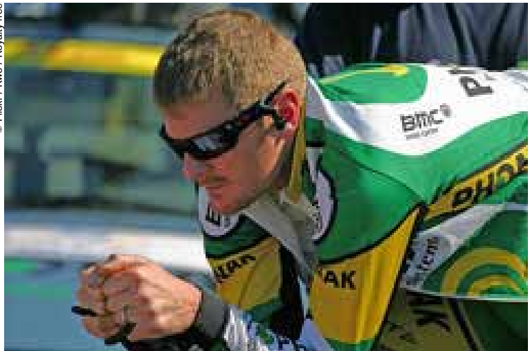
Floyd Landis dio positivo por testosterona en un análisis que se le hizo durante el Tour de Francia 2006.

Las acusaciones de dopaje, los escándalos e incluso las muertes de corredores pesan sobre los medios del ciclismo desde hace muchos