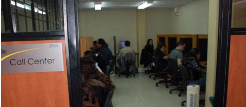
Oficina del Programa de Protección Social (PPS) que atiende a los beneficiarios del bono. Como esta oficina hay 22 en todo el país.