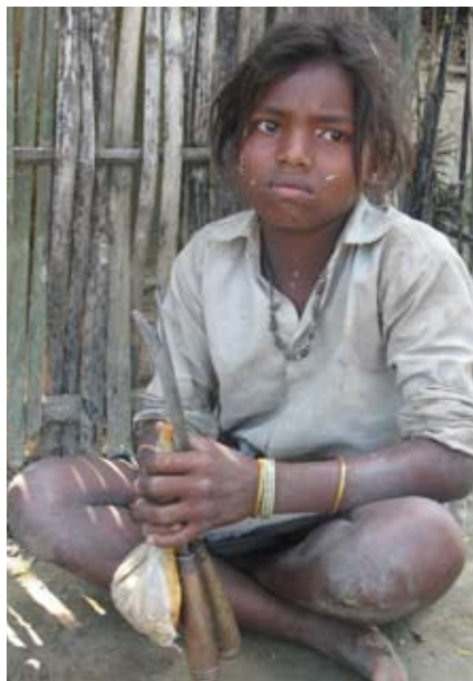
Nepal viene dando prioridad a la educación desde hace algunos años.

●●● matriculadas en los diez primeros grados del sistema de enseñanza.