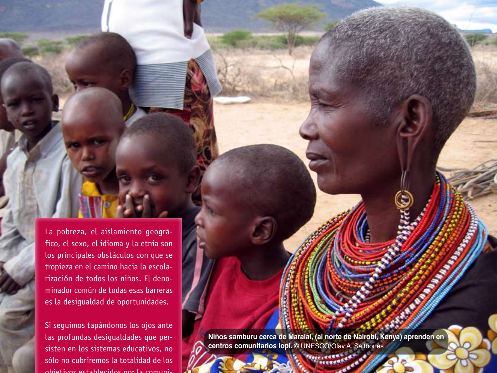
Niños samburu cerca de Maralal, (al norte de Nairobi, Kenya) aprenden en centros comunitarios lopi.

La pobreza, el aislamiento geográfico, el sexo, el idioma y la etnia son los principales obstáculos con que se tropieza en el camino hacia la escolarización de todos los niños. El denominador común de todas esas barreras es la desigualdad de oportunidades.