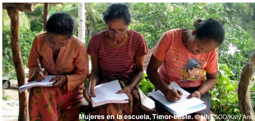
Mujeres en la escuela, Timor-Leste.

que tuvo el mérito de incitar a los países desarrollados a establecer planes contra el iletrismo y plantearse el problema de la eficiencia de sus sistemas educativos. Estos dos aspectos se evalúan hoy mediante las encuestas realizadas en el marco del Programa para la Evaluación Internacional de los Alumnos (PISA), cuyos resultados viene publicando la OCDE desde el año 2000 con una periodicidad trienal. Como la ELCA ha dejado de realizarse, la OCDE ha creado el Programa Internacional para la Evaluación de las Competencias de los Adultos (PIAAC) a fin de subsanar la carencia de un instrumento de medición común para los diferentes países. Se prevé que las primeras evaluaciones de este programa sólo estarán disponibles en 2011.