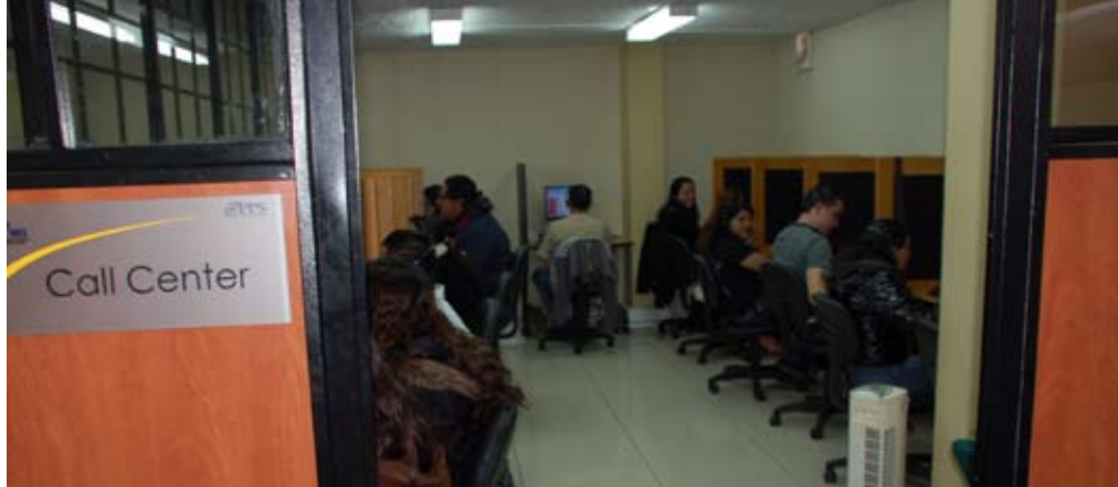
Oficina del Programa de Protección Social (PPS) que atiende a los beneficiarios del bono. Como esta oficina hay 22 en todo el país.

Algo de lo que es consciente Ligia Hernández, de 37 años, beneficiaria del