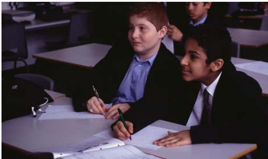
North Westminster School, Reino Unido.

A no ser que se emprenda una acción concertada y tenaz, no sólo no alcanzaremos de aquí a 2015 el objetivo de universalizar la enseñanza primaria fijado por la comunidad internacional, sino