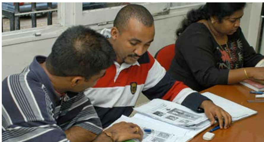
Clase de alfabetización para los trabajadores inmigrantes de Bobigny (Francia).

¿Analfabetismo? ¿Iletrismo? El vocabulario vacila a la hora de definir el fenómeno. En 1958, la UNESCO definía como analfabeta a “toda persona que sabe leer y escribir, comprendiéndolo, un enunciado breve y sencillo relacionado con su vida diaria”. Veinte años después, sobre la base del concepto más elaborado de analfabetismo “funcional”, la Organización definió el analfabetismo como la incapacidad de “valerse de la lectura, la escritura y la aritmética al servicio de su propio desarrollo y el de la comunidad”. Hasta el decenio de 1980, los países