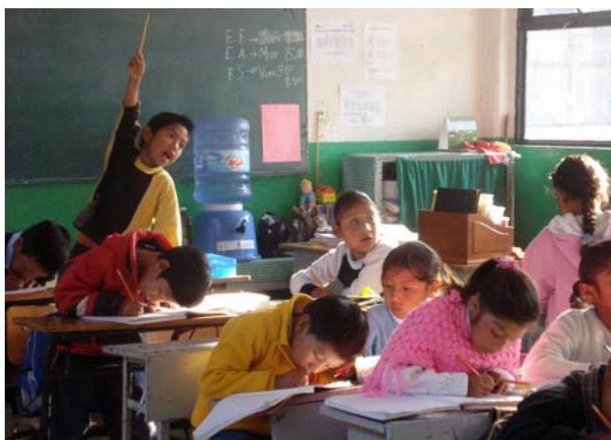
Oportunidades es el principal programa anti pobreza creado por el gobierno de México

Las disparidades dentro de los países reflejan las desigualdades que se dan entre ellos a nivel mundial. En Filipinas y Perú, los niños del quintil de familias pobres cursan cinco años menos de estudios que los hijos de las familias más acomodadas. Sin embargo, el grado de pobreza no es el único factor de marginación y desventaja en la educación. Hay otros obstáculos pertinaces que impiden el acceso a la escuela: el aislamiento geográfico, el sexo, el idioma y la pertenencia étnica. En Senegal, por ejemplo, las probabilidades de que los niños