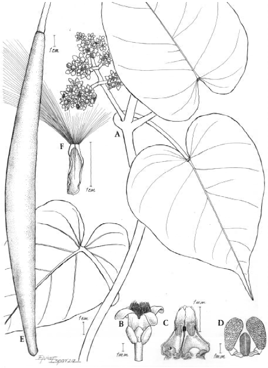
Fig. 1. Marsdenia popoluca : A, rama con inflorescencia; B, flor mostrando los tricomas que surgen de la garganta de la corola; C, ginostegio; D, polinario; E, folículo; F, semilla (Á. Campos 5693, MEXU).