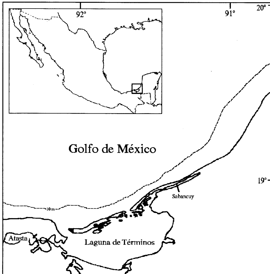
Fig. 1. Área de estudio.

Gerridae (4 especies), Clupeidae, Engraulidae y Ariidae (3 especies), (Amezcu-Linares & Yáñez-Arancibia, 1980).