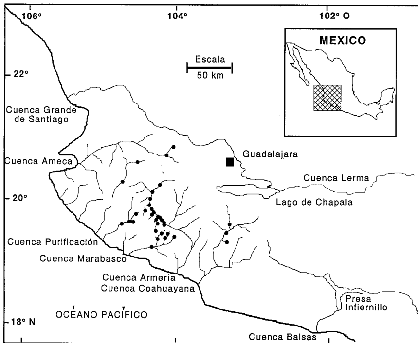
Fig. 1. Mapa del oeste de Jalisco. Muestra las cuencas estudiadas en este trabajo (río Ameca, río Marabasco, río Purificación, río Coahuayana, río Armería) y otras cuencas ubicadas en la región además de la localización de los sitios de estudio. Algunos puntos indican más de un sitio.

La calidad del agua presentó diferencias entre los sitios de muestreo, dado que en algunos de ellos el afluente era alimentado por manantiales y en otros por aguas utilizadas para irrigación. Sin embargo, los segmentos de río donde el ensamblaje de peces se había visto reducido por problemas de calidad de agua,