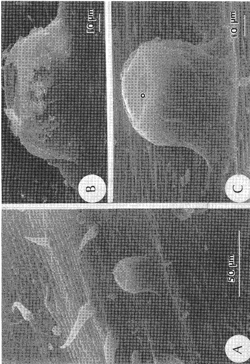
Fig. 2. Fotomicrografías tomadas con MEB de las estructuras estomáticas. A, C: Aloysia polystachya (Bonzani 8); B: Aloysia citriodora (Filippa 4). A: Estoma sobre columna memeliforme (obsérvense también los tricomas eglandulares verrucosos y algunos glandulares); B: Estomas sobre columnas cónico-cilíndrica, en vista lateral; C: Detalle de A, mostrando el ostiolo abierto. Abreviaturas. O: ostiolo.