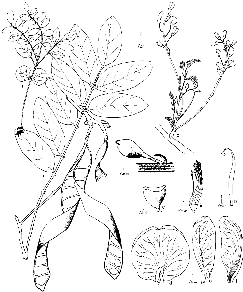
FIGURA 2. Hybosema robustum . a. Rama con hoja e infrutescencia. b. Rama con brotes foliares e inflorescencias. c. Cáliz mostrando los diminutos lóbulos. d. Estandarte cara interna, mostrando el callo basal. e. Ala. f. Pétalo de la quilla. g. Tubo estaminal. h. Gineceo. i. Botón floral mostrando la bráctea subyacente, el pedúnculo floral y el pedicelo. j. Plántula mostrando cotiledones foliáceos, y los eófilos alternos. Infrutescencia, hoja y plántula tomados de M. Sousa S. et al. 13213 ; inflorescencias, botón floral y flor disecada de E. Martínez S. y A. Reyes G. 22047 .