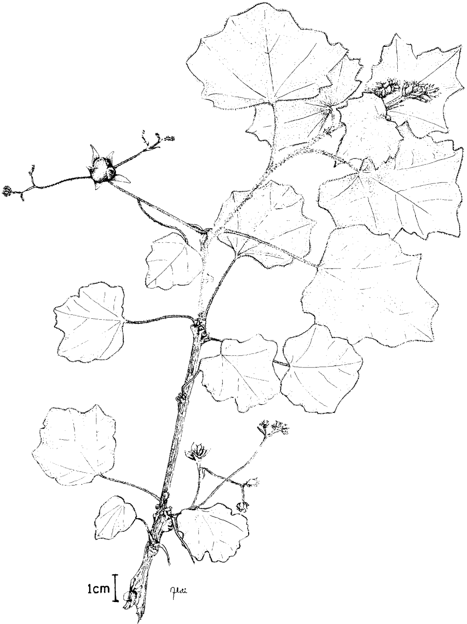
FIGURA 1. Jatropha websteri . Rama con inflorescencias (J. Jiménez R. 111).