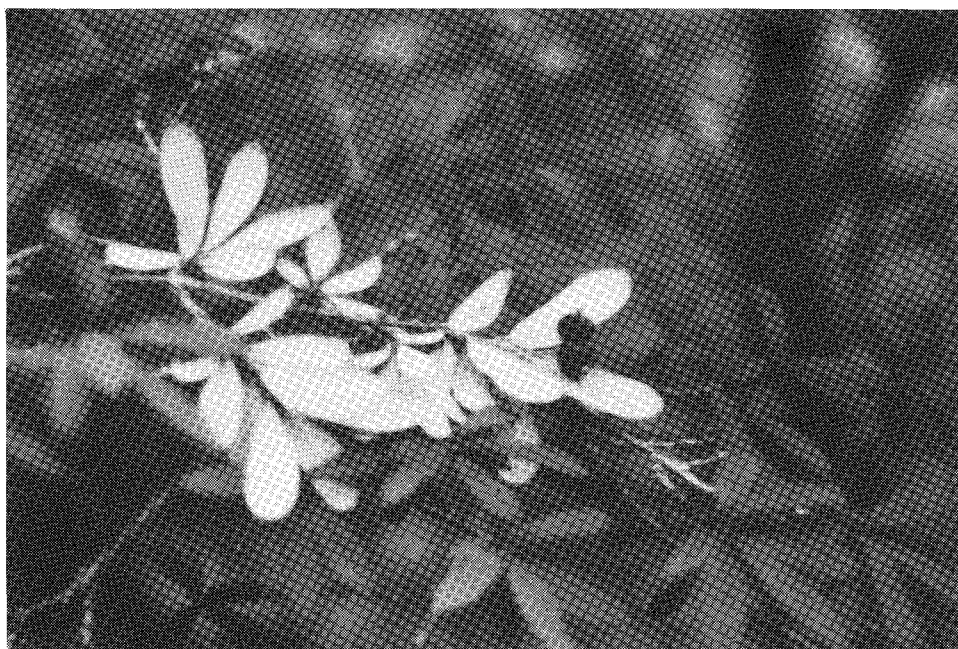
Fig. 3. Fotografía in situ de Lonicera guatemalensis Véliz et Carrillo, presentando lo glauco del envés de la hoja y frutos inmaduros.

Paratipos. GUATEMALA, HUEHUETENANGO, Todos Santos Cuchumatán, 13 abril 1997. (fl), Véliz 97.5936; 28 agosto 1997, (fr) Hernández y Véliz 97.6077; 21 marzo 1998, (fl) Véliz 98.6144; 18 agosto 1999 (fl) Véliz y Morales 99.7205; 21 octubre 1999, (fl,fr) Véliz y Morales 99.7686; (BIGUA, AGUAT, MEXU, NY, MO).