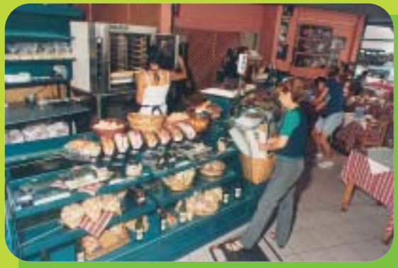
Los hornos son mucho más grandes que los de casa.