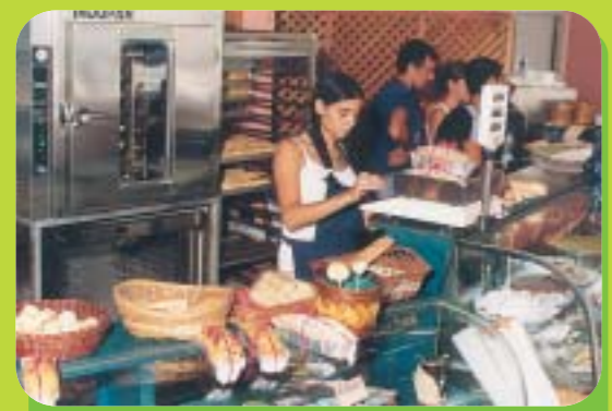
En la panadería se amasan panes muy variados.