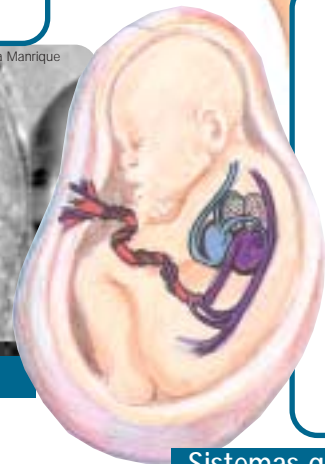
Sistemas que actúan en la vida intrauterina