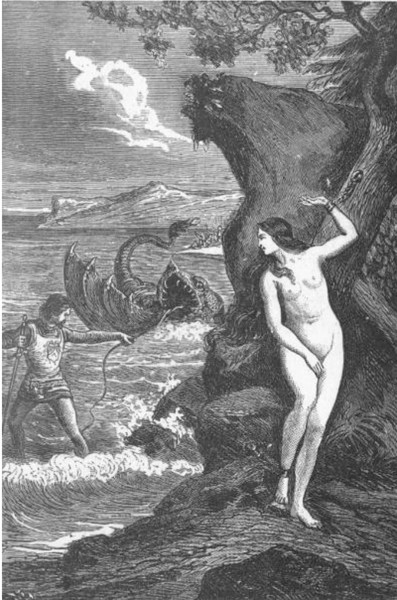
Orlando fué tirando del cable y atrayendo al mónstruo. (Canto XI.)

La orca, arrastrada á pesar suyo por el poderoso brazo