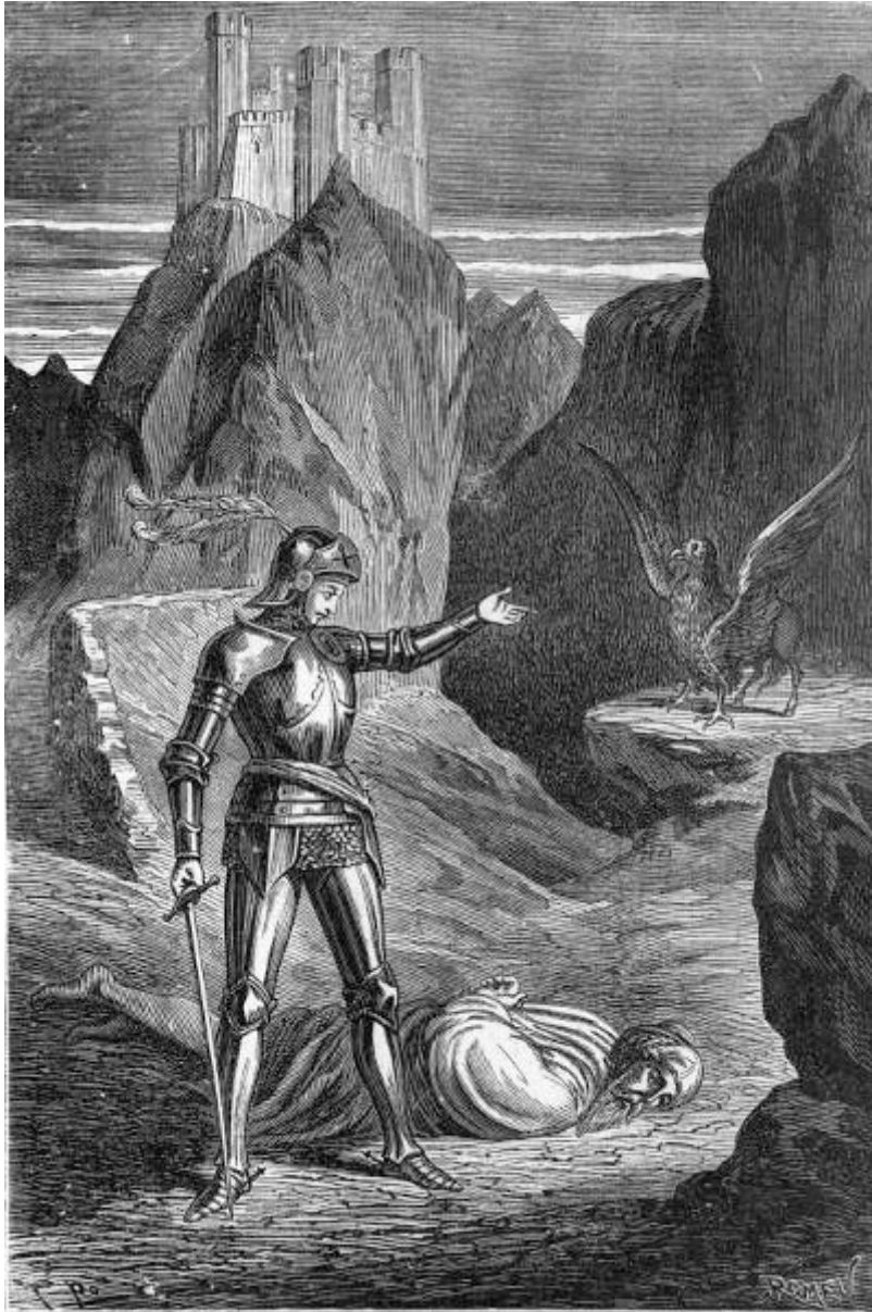
Bradamante vence y sujeta á Atlante de Garena. (Canto IV.)

bastaria para derribar á su contrincante. Desde luego podia emplear este medio como el mas eficaz de todos, sin tener entretenidos á sus adversarios, pero se complacia en manejar la lanza y esgrimir la espada durante algun tiempo, del mismo modo que el astuto gato se complace en jugar con el