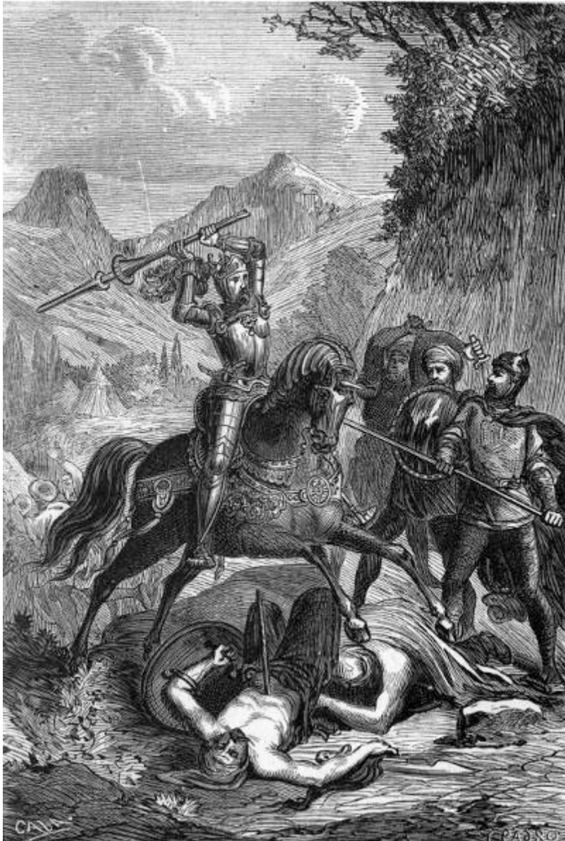
Mandricardo aferró con ambas manos el tronco de lanza que le quedaba. (Canto XIV.)

[Pg 257] Cuando este vió el paso tan mal defendido, sin tener ya quien lo custodiara, adelantóse por el camino que le marcaba la yerba recién hollada, y atraído por los gemidos que oía, con el objeto de cerciorarse por sí mismo de si la belleza de la princesa de Granada era digna de su fama; y saltando por entre los cadáveres, pasó al sitio en que el río presentaba una de sus sinuosidades. En medio del verde prado estaba Doralicia (que tal era el nombre de la doncella), sentada al pie de un añoso fresno y llorando amargamente: sus lágrimas se deslizaban hasta su turgente seno, como se suceden las aguas de un riachuelo al brotar de un manantial: su rostro expresaba á la vez el dolor que le causaba la muerte de sus compañeros, y el temor que le asaltaba por su propia suerte. Apenas vió acercarse á aquel guerrero empapado en sangre y con aspecto feroz y sombrío, sintió redoblar su espanto, y empezó á lanzar agudos gritos, que hendían los aires, aterrada