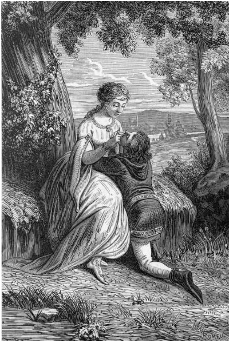
Angélica no se cansaba de contemplar al jóven Medoro. (Canto XIX.)

Angélica dejó cojer á Medoro aquella flor que nadie habia tocado hasta entonces, porque nadie habia sido tan afortunado que pudiese hollar tan maravilloso jardin. Sin embargo, para cohonestar hasta cierto punto aquella union, se celebró con ceremonias santas el matrimonio, bajo los auspicios del amor, y siendo prónuba la mujer del pastor. Celebráronse las bodas bajo aquel rústico techo con la mayor solemnidad que fué posible, y por espacio de un mes se entregaron ambos amantes á los tranquilos deleites de su pasion. Angélica no podia estar un momento separada de su Medoro; no se cansaba de acariciarle; y á pesar de verse continuamente en sus brazos, sus deseos y sus voluptuosos impulsos renacian sin cesar. Ya permaneciera en la cabaña, ya saliera fuera de ella, tenia dia y noche á su lado al hermoso