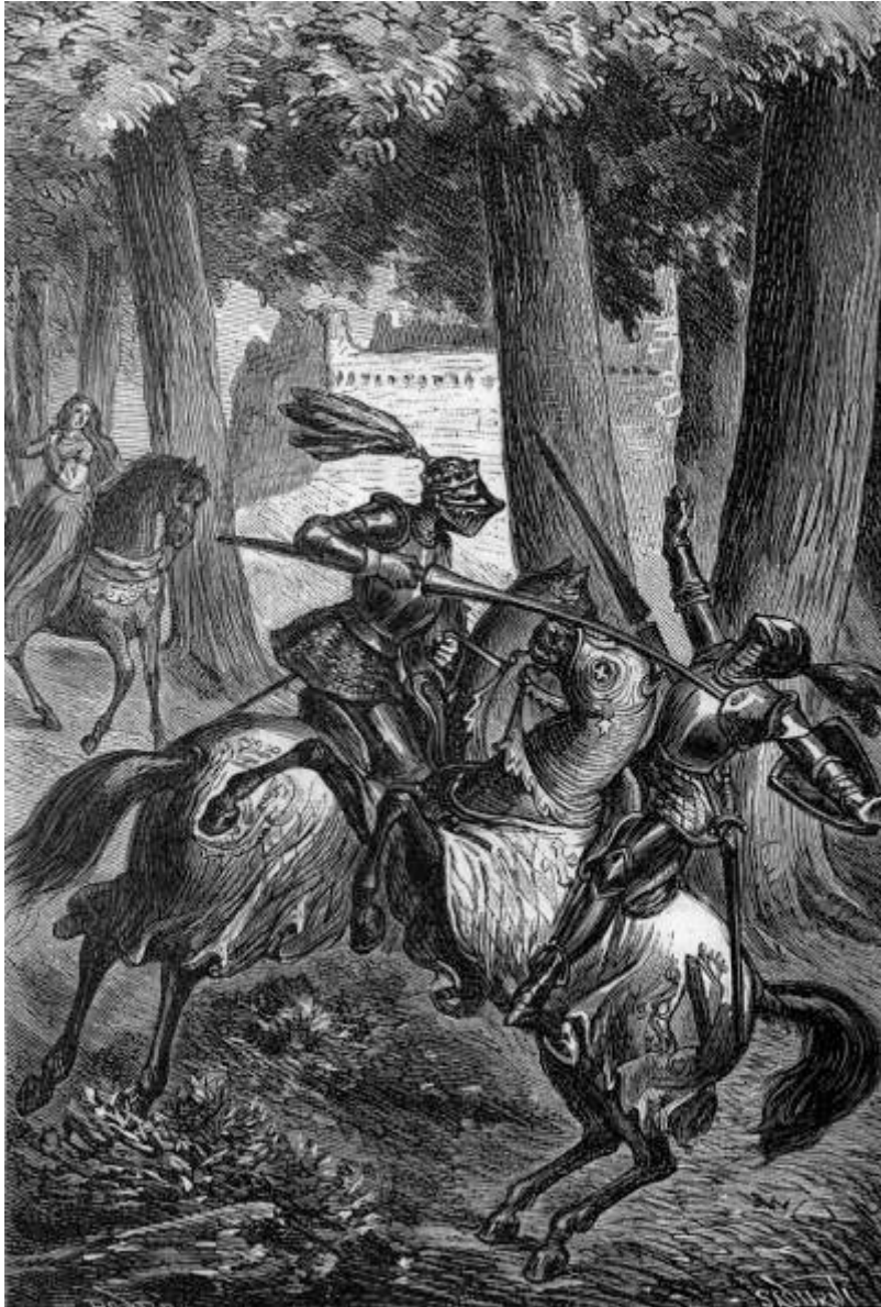
Zerbino le atravesó el hombro de parte á parte. (Canto XXI.)

[Pg 449]de quien hablo llamóse Argeo; era esposo de esta pérfida mujer, y desgraciadamente la amó hasta el extremo de dar por ella al olvido el sentimiento de su propia dignidad; pero esa infame, más voluble que la hoja caída del árbol en otoño y empujada en todas direcciones por el viento, olvidó pronto el cariño que durante algun tiempo habia sentido por su marido, y fijó todos sus conatos y todos sus deseos en conseguir el amor de mi hermano. Mas no opone tanta resistencia á los embates de las olas el Acrocerauno [146] de infamado nombre, ni se muestra tan vigoroso contra Boreas el pino que ha renovado más de cien veces su cabellera y cuyas raices tienen tanta profundidad cuanta es la altura de la montaña en que está plantado, como resistencia opuso mi hermano á los ruegos de esa mujer, nido de todos los vicios más viles y repugnantes.