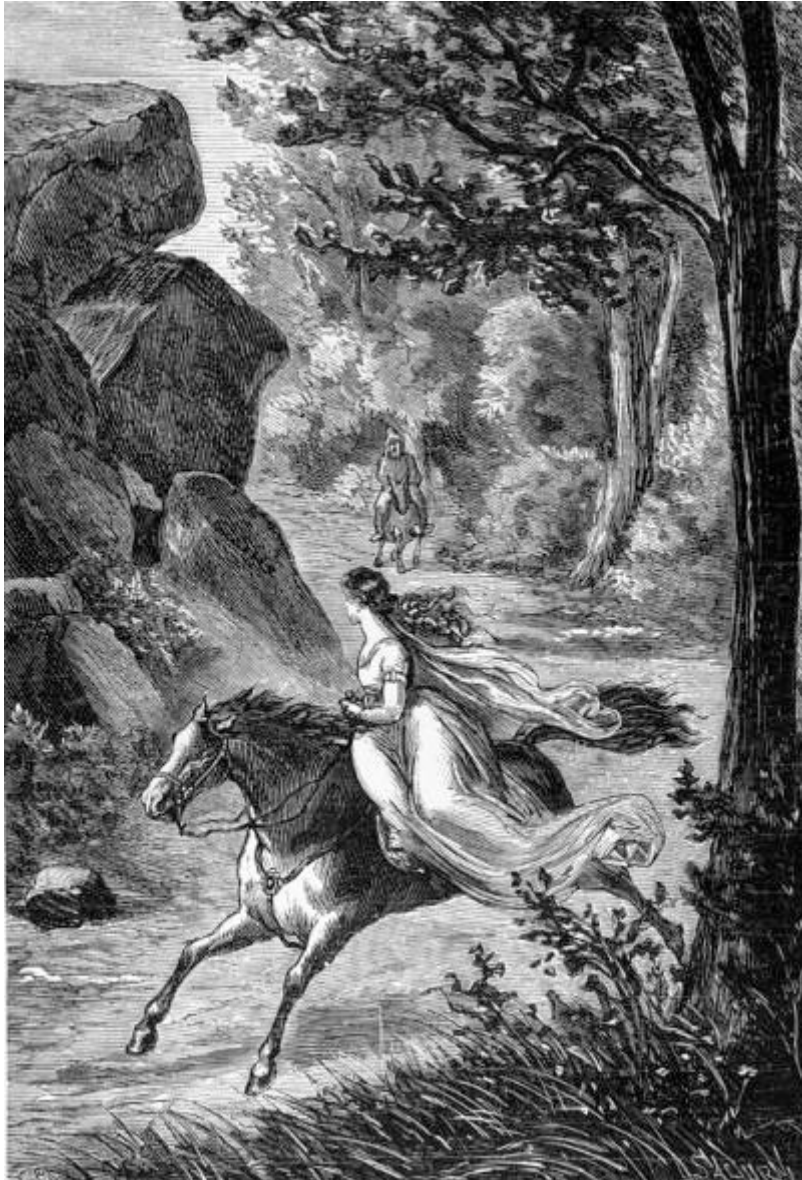
El ermitaño aguijó á su asno al ver que Angélica se alejaba más y más. (Canto VIII.)

[Pg 131]quería permanecer más tiempo con él, aguijó con desesperacion á su asno sin conseguir que acelerara su paso lento y tardío. Al ver que Angélica se iba alejando más y más, y temiendo perder su pista, recurrió á los espíritus infernales, y á su evocacion apareció una turba de demonios. Eligió á uno de entre ellos, é informándole préviamente de sus intenciones, hízole penetrar en el cuerpo del corcel de Angélica, que con su rápida marcha le arrebatava el corazon al par que la doncella. Y cual perro sagaz que, acostumbrado á seguir por el monte la pista de las zorras ó de las liebres, se dirige corriendo por un lado, mientras que la caza escapa por otro, despreciando al parecer su rastro, hasta que se planta en un sitio por donde precisamente ha de pasar su víctima, que cae inevitablemente entre sus dientes, siendo en el acto abierta y destrozada, el ermitaño propúsose del mismo modo salir al encuentro de la