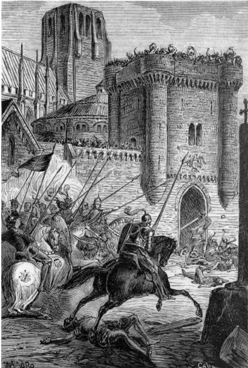
Carlomagno acude con sus paladines á impedir los estragos que Rodomonte causa en París. (Canto XVII.)

sobre el sarraceno era bastante á cansar su sanguinaria diestra, ni á impedir que siguiera sacudiendo y haciendo poco á poco pedazos la gran puerta del alcázar, en la cual abrió tantos boquetes que fácilmente podía ser visto y ver á su vez á cuantos llenaban el patio principal, en cuyos semblantes se pintaba la palidez de la muerte. Oíanse resonar gritos y lamentos femeniles bajo aquellas elevadas y espaciosas bóvedas; las mujeres desconsoladas iban corriendo de uno á otro lado del edificio, pálidas y afligidas, y despidiéndose de todos los aposentos y de sus lechos nupciales, que pronto tendrían que abandonar á gentes extrañas.