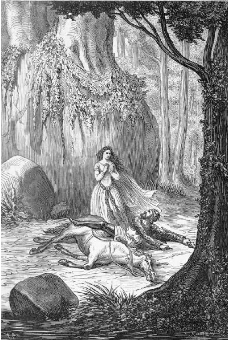
La jóven hubo de sacarle de debajo del caballo. (Canto I.)

—Voy á satisfacer tu deseo. Sabe que te lanzó fuera de la silla el esforzado valor de una doncella gallarda, pero