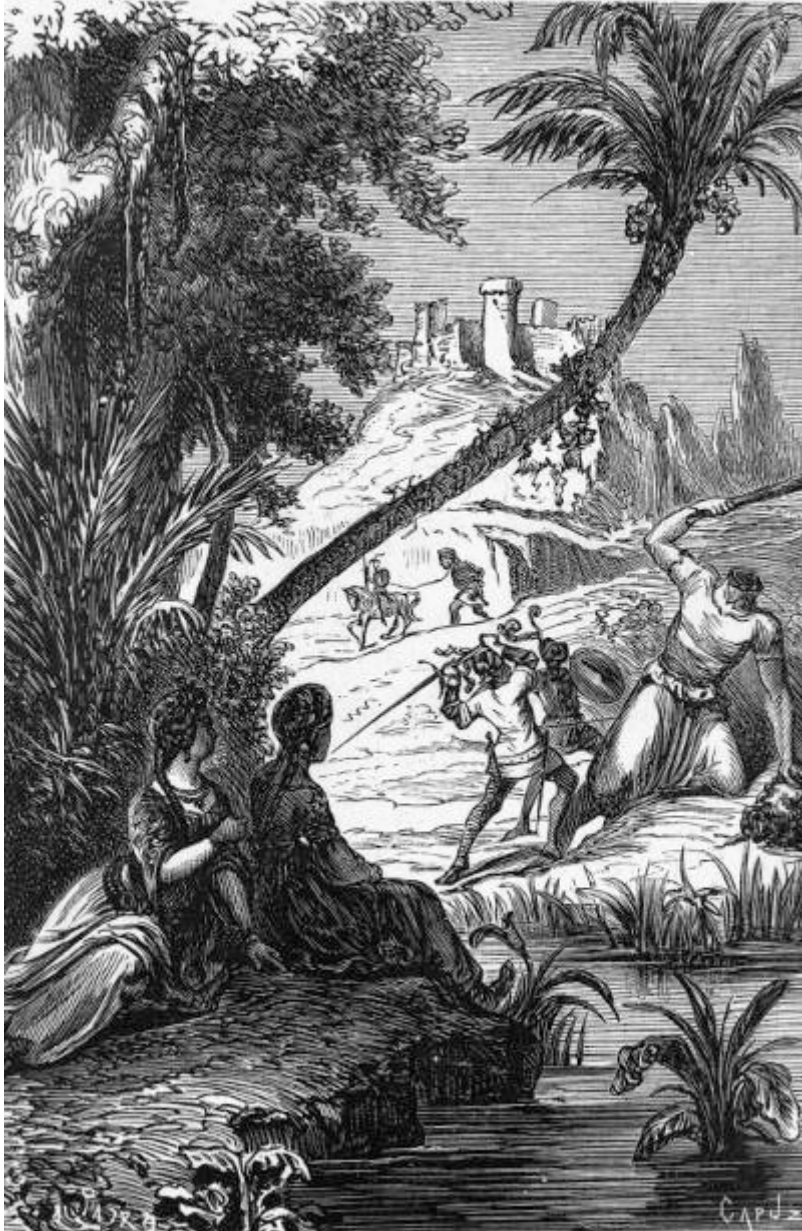
Combate entre Orrilo y los hermanos Grifon el blanco y Aquilante el Negro. (Canto XV.)

[Pg 291]no quiero pecar de difuso; pues nadie ignora ya esta historia, á pesar de que el autor, confundiendo el nombre de su padre, tomó, no sé cómo, uno por otro. Continuaré, pues, refiriendo el combate que los dos jóvenes emprendieron á ruegos de las dos damas.