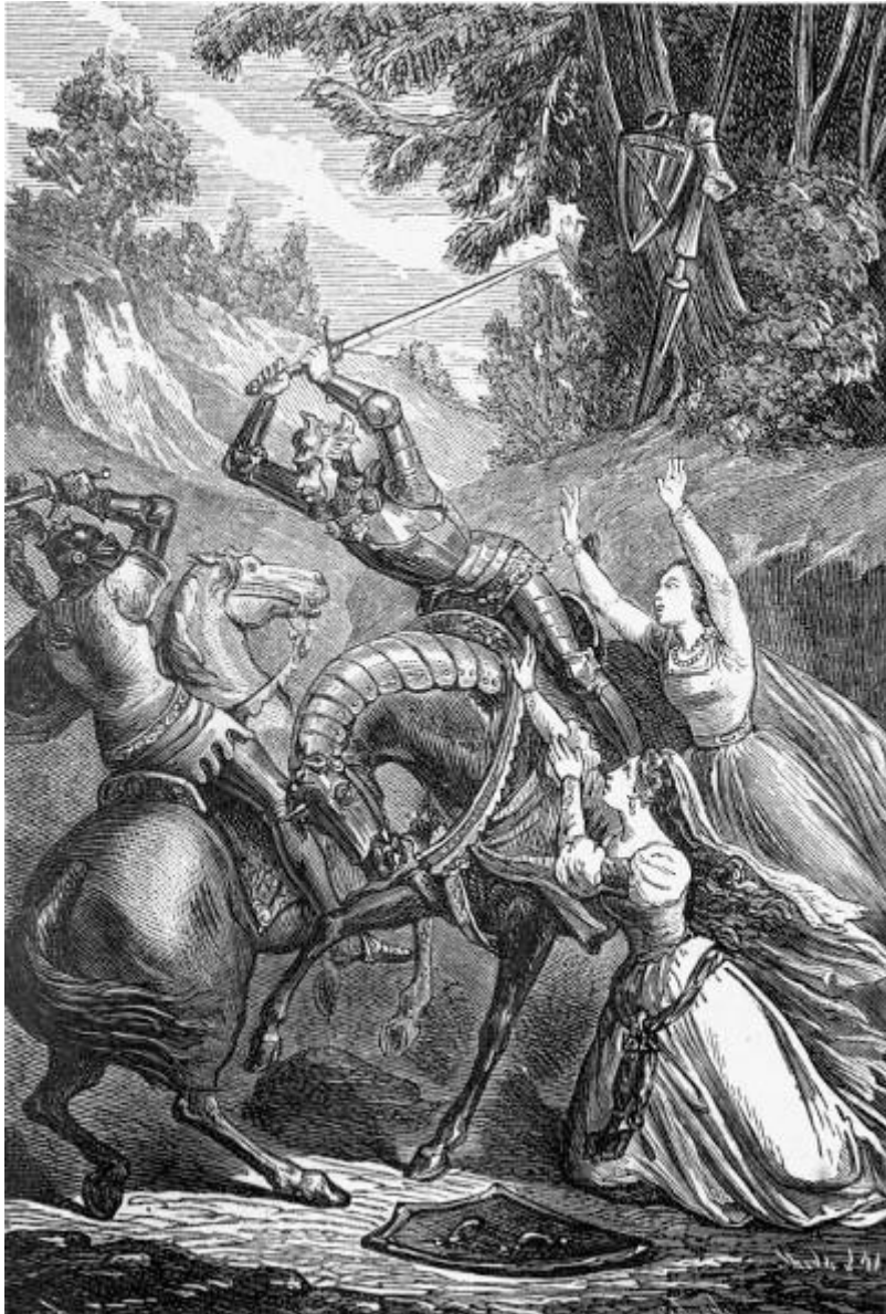
Combate entre Zerbino y Mandricardo. (Canto XXIV.)

[Pg 527]sobre el yelmo del Tártaro. Casi quedó tendido el soberbio Sarraceno sobre el cuello de su caballo ante la violencia de aquel golpe, que le habría dividido la cabeza en dos pedazos, á no estar encantado el yelmo. Mandricardo no difirió su venganza, y sin pronunciar una sola palabra, dirigió á su adversario un furioso tajo sobre el almete, esperando hendirle hasta el pecho: Zerbino, con la vista y el pensamiento fijos en los movimientos del Pagano, volvió rápidamente el caballo hácia la izquierda; pero no tan á tiempo que consiguiera evitar aquel mandoble. El acero del Sarraceno le partió el escudo, rompió y desató el brazal, hirióle el brazo, destrozó el arnés y se corrió hasta el muslo.