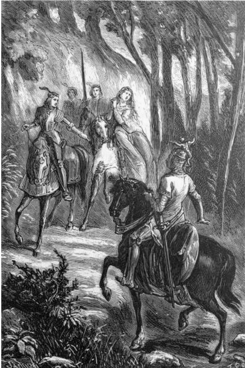
Grifon encuentra á Origila. (Canto XVI.)

[Pg 299]partes: avergüénzase de sí mismo y de su amor, y ni se atreve á confesarlo ni consigue curarse de él.