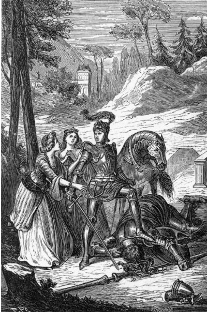
¡Envaina el acero!, le gritaron las dos damas. (Canto VII.)

[Pg 109]claros soles, de dulcísima mirada y parcos movimientos: no parecía sino que el amor jugueteaba revolando en su derredor, y que desde ellos despedía todas las flechas de su carcaj, arrebatando visiblemente los corazones. La envidia no hubiera podido hallar defecto alguno en su bien delineada nariz, que en líneas regulares dividía el rostro; bajo ella aparecía, como entre dos pequeños valles, la boca matizada con los rojos colores del cinabrio más puro, y en la que se descubrían dos hileras de escogidas perlas, que un bello y dulce labio ocultaba y permitía ver alternativamente: de ella salían halagüeñas palabras, capaces de ablandar el corazón más duro y resistente: en ella se formaba por último aquella encantadora sonrisa, que hacía entrever á su arbitrio las delicias del Paraíso. Su hermoso cuello era blanco como la nieve, y cual la leche su pecho: el primero torneado; el segundo lleno y elevado. Sus pechos, que parecían de marfil, oscilaban