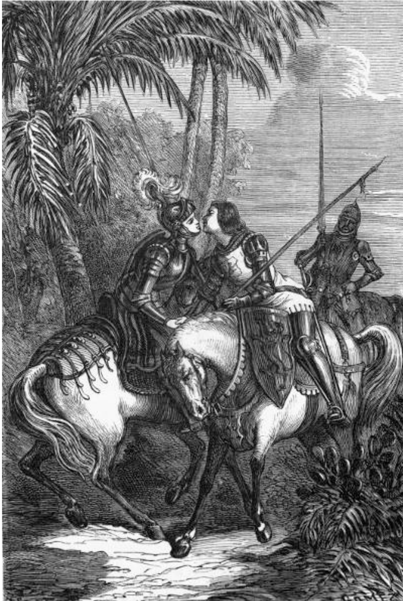
Astolfo, acompañado de Sansoneto, encuentra á Marfisa en el camino de Damasco. (Canto XVIII.)

[Pg 369]en ellos sus miradas con más detención, conoció al duque Astolfo. Recordó en seguida las atenciones que con ella tuvo el caballero durante su estancia en el Catay, y le llamó por su nombre, quitóse las manoplas, se alzó la visera del yelmo, y á pesar de su altivez, no vaciló en correr á él con los brazos abiertos. Astolfo, por su parte, la estrechó entre los suyos con grande afecto y deferencia. Dirigiéronse luego mútuas preguntas acerca del objeto de su viaje; y respondiendo primero el Duque, le manifestó que iba á Damasco para asistir al torneo á que habia invitado el rey de Siria á todos cuantos campeones quisieran ostentar sus brillantes proezas. Marfisa, pronta siempre á dar muestras de las suyas, contestó en seguida:—«Quiero ir con vosotros á ese torneo.»—Astolfo y Sansoneto se mostraron sumamente gozosos por tener tal compañera, y prosiguiendo su interrumpido viaje, llegaron á Damasco la