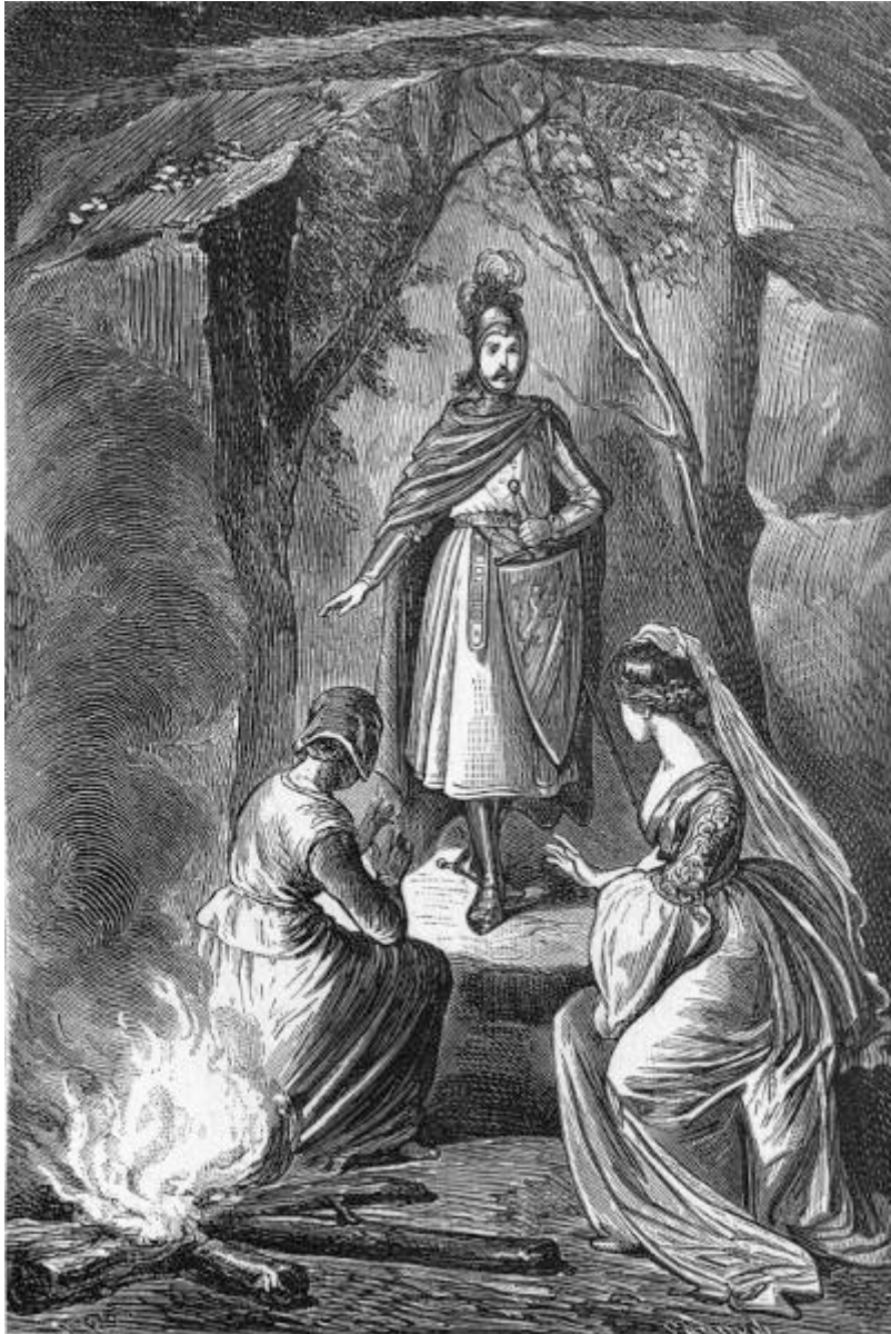
En medio de la cueva, vió Orlando una doncella de agradable rostro, acompañada de una vieja. (Canto XII.)

[Pg 227]Orlando estuvo un momento pensando lo que debía ser aquello: decidido despues á averiguarlo, apeóse de Brida-de-oro, le ató á un árbol, se acercó con gran cautela á la entrada de la cueva, y separando la maleza penetró en ella sin anunciarse. Una serie de numerosos escalones conducia al fondo de la gruta, donde no parecia sino que las personas estuvieran enterradas en vida. Era la tal caverna de una extension considerable: estaba cortada á pico y abovedada, y á pesar de su profundidad no carecia enteramente de la luz del dia; pues aunque pasaba muy poca por la entrada, la recibia con bastante intensidad por un gran agujero abierto á la derecha de la roca. En medio de la cueva, y al lado de un hogar, se veia á una doncella de agradable rostro que apenas habria cumplido los quince años. Bastóle al Conde una sola mirada para apreciar su belleza, que convertia aquel sitio